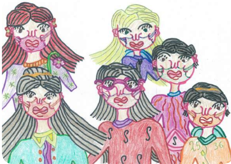
„Наставнице, ово сте ви са нама. Имате маску и чувамо се“. Ковиљка

Највећи изазов у раду од када постоји медицинска служба Установе је борба са корона вирусом. Почетак те борбе за лекаре и медицинске техничаре креће од марта месеца, када је СЗО прогласила пандемију и када је непријатељ постао заједнички на свим континентима, у свим системима, у свим популацијама. Посао здравствених радника у систему социјалне заштите није ни мало лак и има своје особености, а условима пандемије потребна је додатна спремност и ангажовање, како би се деци која су ометена у развоју пружила најбоља могућа здравствена заштита. Кључ здравствене делатности, посебно у популацији наших корисника, је превенција.